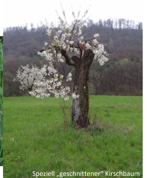
Speziell „geschnittener“ Kirschbaum