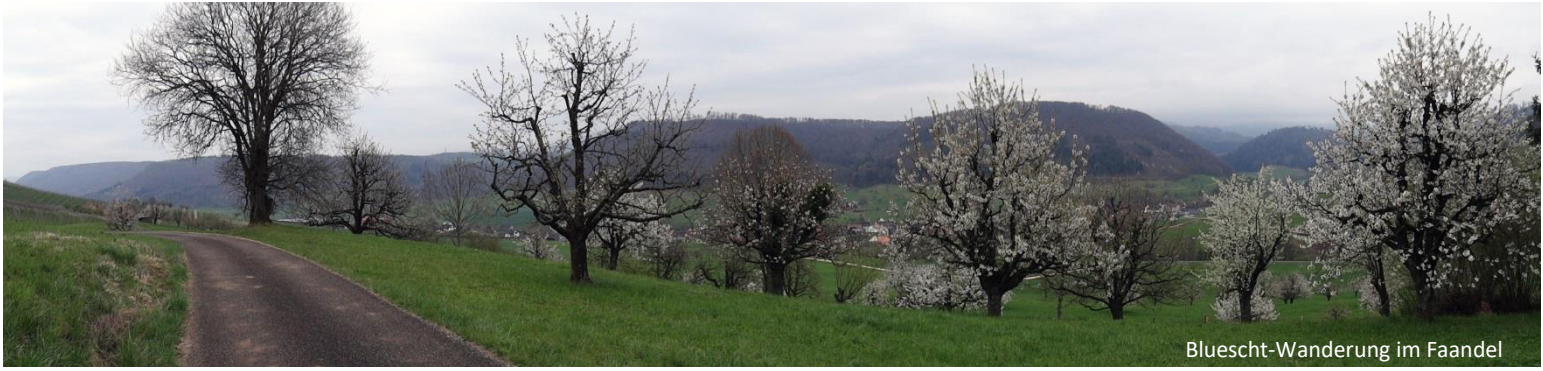
Bluescht-Wanderung im Faandel