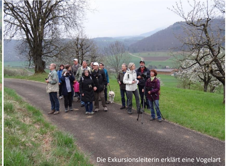
Die Exkursionsleiterin erklärt eine Vogelart