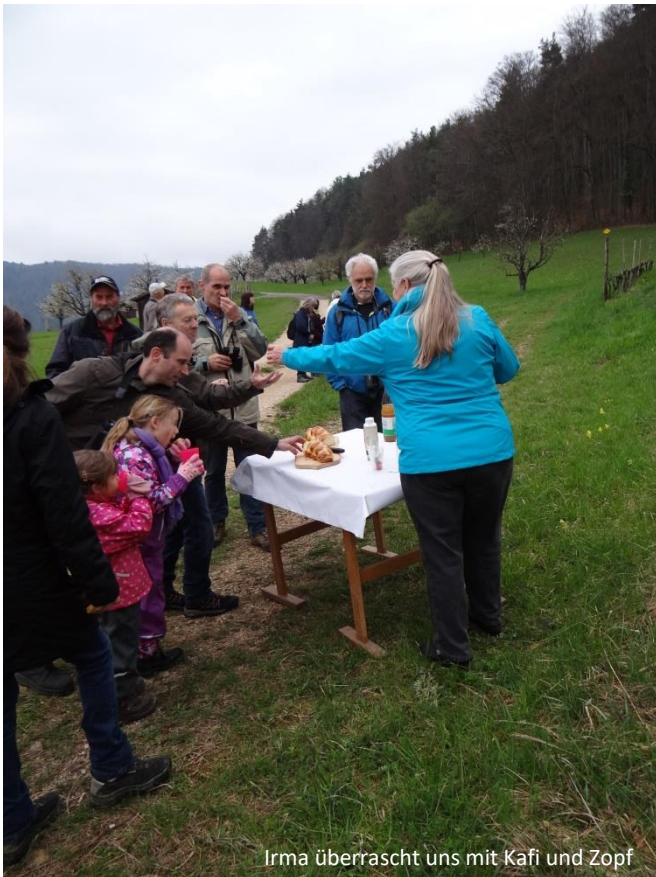
Irma überrascht uns mit Kafi und Zopf