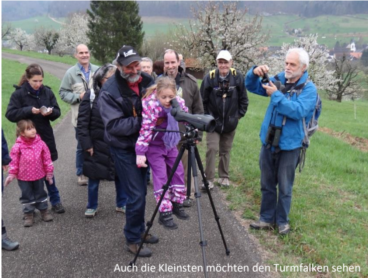
Auch die Kleinsten möchten den Turmfalken sehen